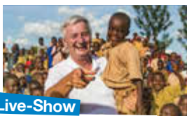
Live-Show mit Reiner Meutsch