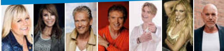
Gaby Baginsky, Ireen Sheer, Olaf Berger, Peter Orloff, Vincent Gross, Loona und Olaf Henning