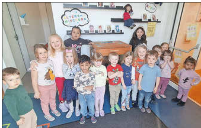
Kleine Wunder in der KiTa Villa Regenbogen: Küken schlüpfen im Brutautomat

Große Aufregung herrschte am Morgen des 02.03.26 in der KiTa in Selbach. An diesem Morgen wurde uns ein Brutautomat samt zahlreicher Hühnereier gebracht. In den kommenden 4 Tagen konnten die Kinder hautnah erleben wie die Küken aus ihren Eiern schlüpfen. Hierbei wurde in allen Gruppen das Thema „Vom Ei zum Küken“ aufgegriffen und mittels Geschichten, Liedern, Fingerspielen etc. vertieft. Auch die Wackelzahnkinder sprachen mit ihren Vorschulerzieherinnen über die Entstehung der Küken und erstellten hierzu ein eigenes Logikpuzzle. Absolutes Highlight war jedoch die Betrachtung eines Küken im Stuhlkreis. Der kleine Gast wurde von allen Kindern liebevoll umsorgt und beäugt. Nach einer Woche fiel der Abschied zunehmend schwer. So manches Kind hatte die kleine piepsende Rasselbande fest ins Herz geschlossen.