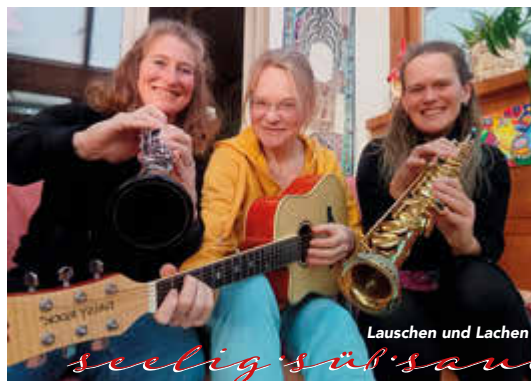
Lauschen und Lachen

seelig-süß-sauer Wohlfühlkonzert Eintauchen und Mitschwingen