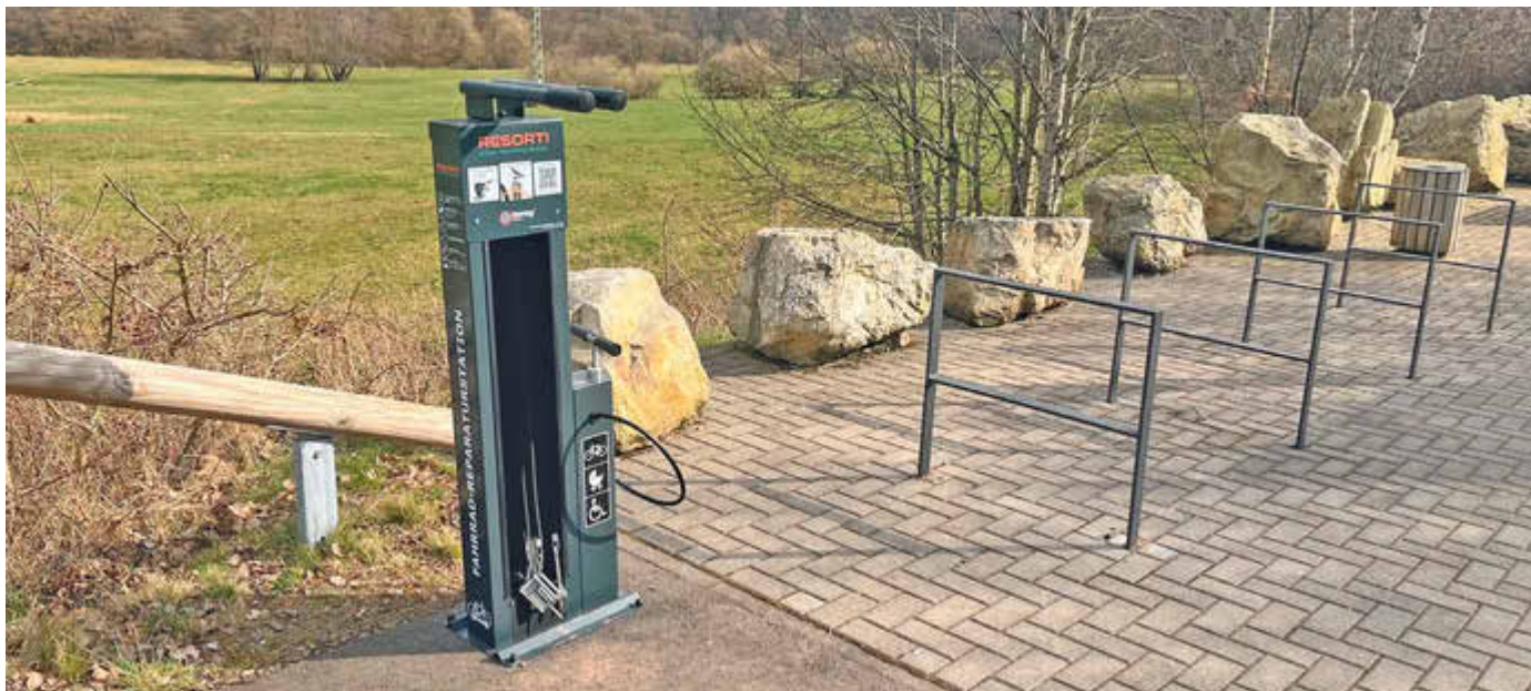
Die neue Fahrradreparaturstation am Rastplatz in Sötern

Die Gemeinde bittet um einen sorgsamen Umgang mit der neuen Einrichtung, damit sie möglichst lange allen Nutzerinnen und Nutzern zur Verfügung steht.