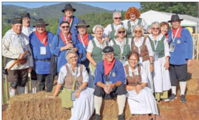
Walhauser Köhler in der Schweiz