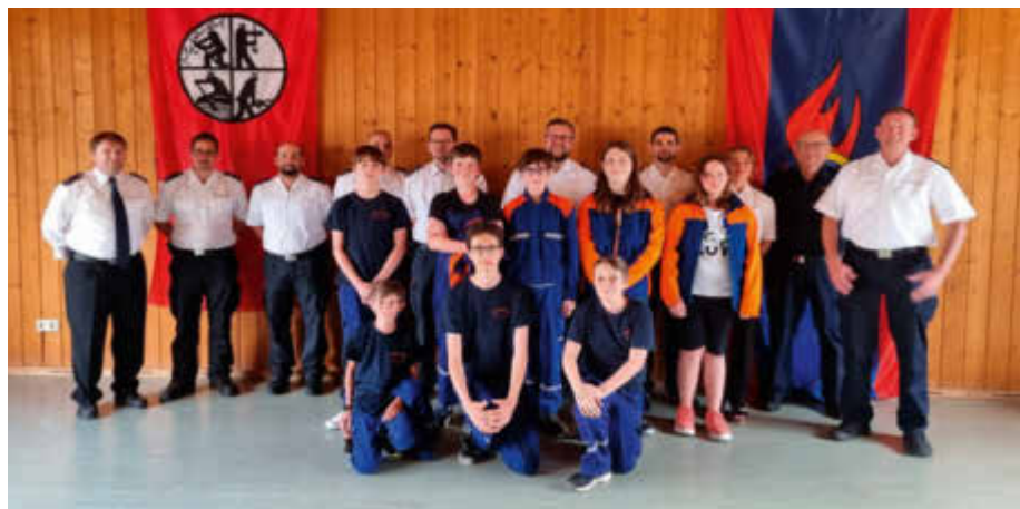
Mitglieder der Jugendwehr und die Führungskräfte der Aktiven

Nachdem am 01.01.2023 die Löschbezirke Gonnweiler, Türkismühle und Walhausen zum Löschbezirk Mitte zusammengeschlossen wurden, erfolgte nun ein nächster bedeutender Schritt im Rahmen der Fusion. Mit der Gründung einer gemeinsamen Jugendfeuerwehrgruppe sind seit dem 16.06.2023 auch die Nachwuchskräfte offiziell vereint. Oberfeuerwehrmann Thomas Huhn übernimmt die Funktion