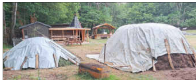
Meilerbaustand vor 1 Woche