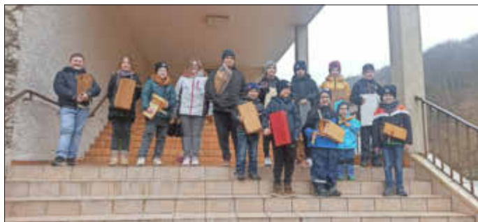
Von Kinder- Für Kinder!

Ebenfalls möchten wir uns bei allen Eiweilerinnen und Eiweiler für ihre Spende herzlich bedanken.