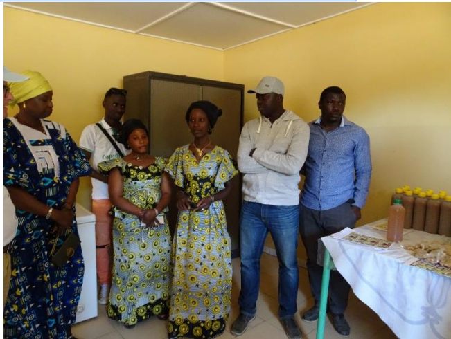
Obst und Gemüseverarbeitung