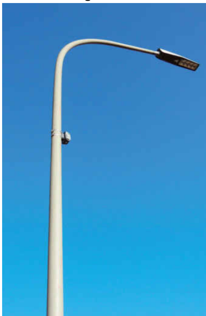
Die in Eiweiler verwendeten LED-Leuchten mit intelligenter Steuerung werden auch in Neunkirchen Nahe installiert

Unabhängig von den Arbeiten in Neunkirchen/Nahe werden von energis nach und nach die Leuchten in allen weiteren Ortsteilen flächendeckend auf moderne LED-Technik umgestellt. Lediglich die zum Teil noch vorhandenen freihängenden Straßenlampen können nicht auf LED-Technik umgestellt werden. Diese werden in Zukunft von Mastleuchten ersetzt. Kürzlich installierte Natriumdampflampen werden ebenfalls aufgrund ihrer energetischen Effizienz nicht ausgetauscht und bleiben weiterhin im Gebrauch. Insgesamt schätzen wir, dass die Stromkosten durch die Umstellungen um mindestens 1/3 gesenkt werden.