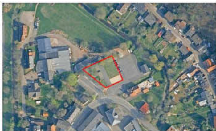
Luftbild: Planungsfäche im Ortszentrum von Nohfelden

Durch die Anlage eines hochwertigen Spielplatzes in zentraler Lage möchte die Gemeinde Nohfelden, insbesondere für Familien mit Kindern, ihre Attraktivität steigern. Die dafür vorgesehene Fläche befindet sich an der Straße ‚Am Burghof‘, in unmittelbarer Nachbarschaft zum Rathaus und zur historischen Burg. Das geplante Baufeld umfasst die zentrale Rasenfläche und die westlich angrenzenden PKW-Stellplätze bis zur anschließenden baumbestandenen Grünfläche. Die Gesamtfläche des Planungsbereiches beträgt ca. 1220 qm, davon entfallen ca. 620 qm auf den geplanten Spielplatz.