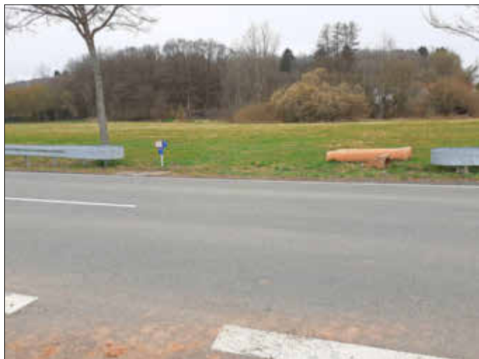
Erwin Barz, Ortsvorsteher Neunkirchen / Nahe

Auf der L326 wurde in der Fahrtrichtung Eiweiler ungefähr 100m nach dem Ortsausgang 2 Betonrohre und ein Betonstutzen illegal entsorgt. Gibt es Hinweise auf ein Fahrzeug, welches in diesem Bereich die Rohre abgekippt hat. Ihre Beobachtungen können sie gerne an die Ortpolizei in Nohfelden oder an mich unter der Telefonnummer 06852-1600 weitergeben. Die Rohre müssen nun auf Kosten der Allgemeinheit entsorgt werden.