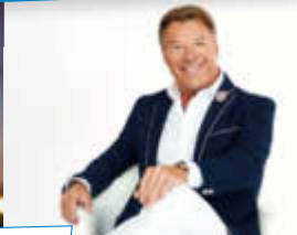
Tim Toupet, Ireen Sheer und Patrick Lindner

Erleben Sie eines der schönsten Länder der Welt und die einzigartige Atmosphäre eines Konzertes auf einer Namibischen Lodge, mit drei Highlights der deutschen Schlagerwelt: Ireen Sheer, Tim Toupet und Patrick Lindner. Das Konzert „ Stars unter Afrikas Sternen 2023 “ zugunsten der Reiner Meusch Stiftung FLY & HELP werden Sie noch lange in Erinnerung behalten.