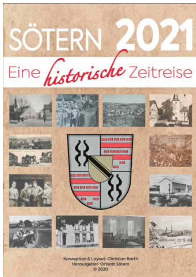
Deckblatt Kalender Sötern 2021