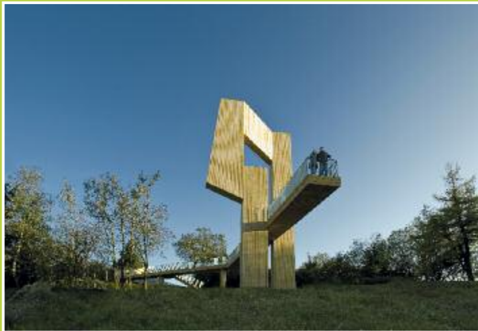
phormat/ Elke Dubois