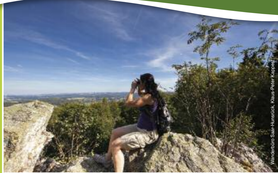
Wandertour Saar-Hunsrück, Klaus-Peter Kappest